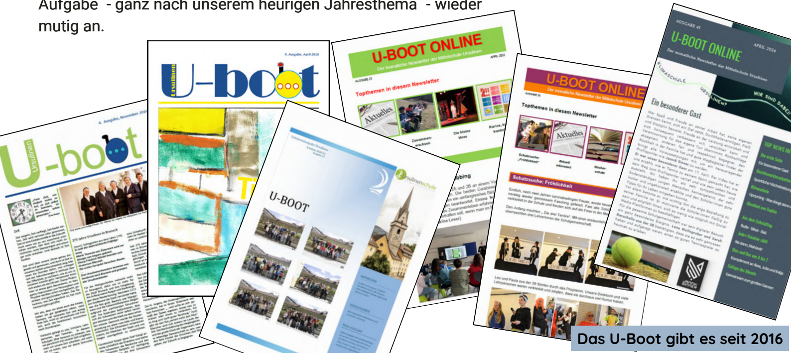
Bild des Monats