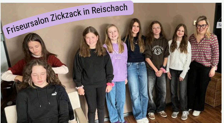
Friseursalon Zickzack in Reischach