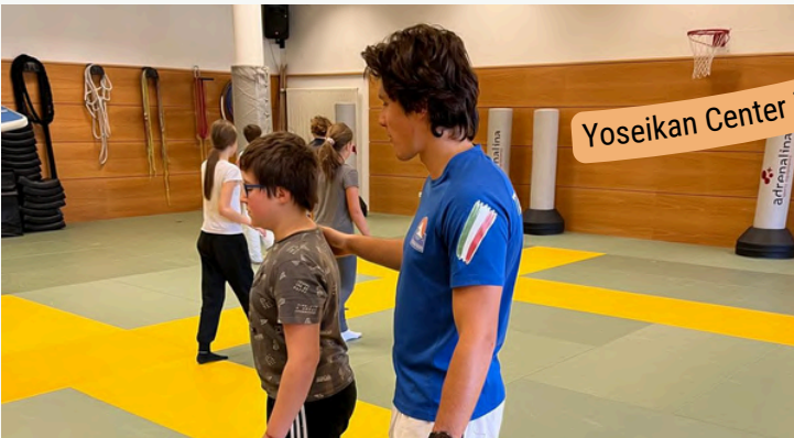
Yoseikan Center in Bruneck